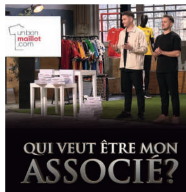
Vu à l'émission QVEMA sur M6 en 2023