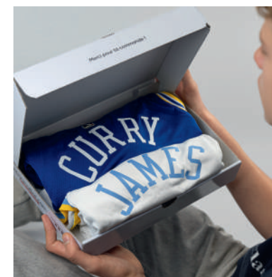
Des maillots authentiques (foot-rugby-basket)